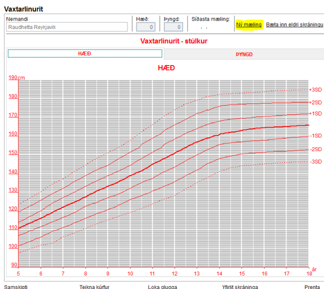
Mynd 2: Smellt er á „Ný mæling“ og virkjust þá hæðar- og þyngdargluggarnir.