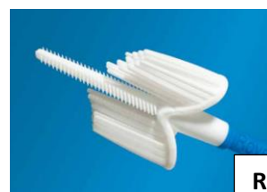
Rovers Cervex-Brush Combi®